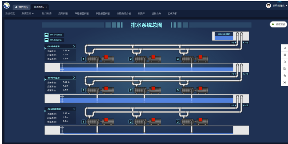
图 煤矿设备实时监视

以高效、稳定的时序数据库保障设备数据实时展示，利用设备组态+实时数据预警的方式，实现数据报警精准定位异常位置，提升现场定位故障问题的效率。