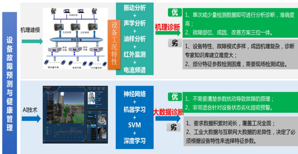
图 机理模型和人工智能相结合

在煤矿企业现有自动化监控系统和转动设备外加振动传感器、采集器的基础上，充分利用大数据信息，将机理诊断与人工智能诊断相结合，进一步提高煤矿设备故障诊断的准确率。在设备监测早期缺乏大量历史监测样本时采用基于机理模型的诊断方法，在积累了一定历史监测数据以后则采用基于人工智能的故障诊断技术，将整体提高设备故障诊断准确率。